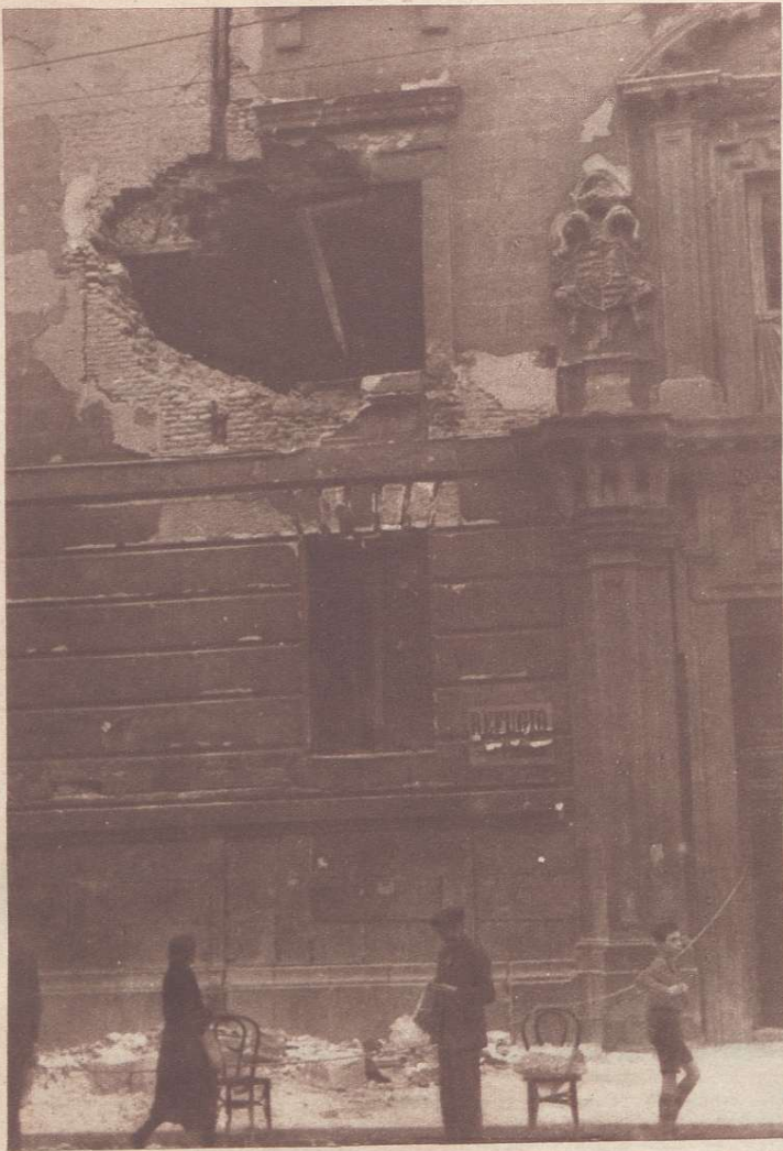
Calle de Alcalá: La Academia de San Fernando.