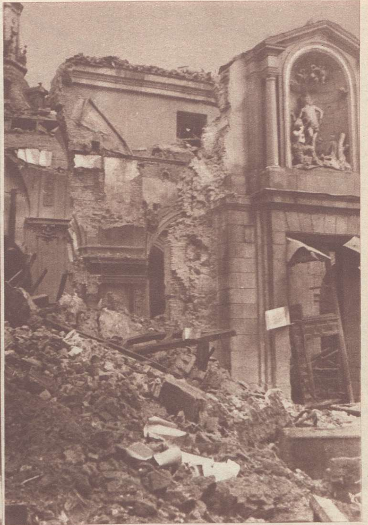
Ruínas de la iglesia de San Sebastián.