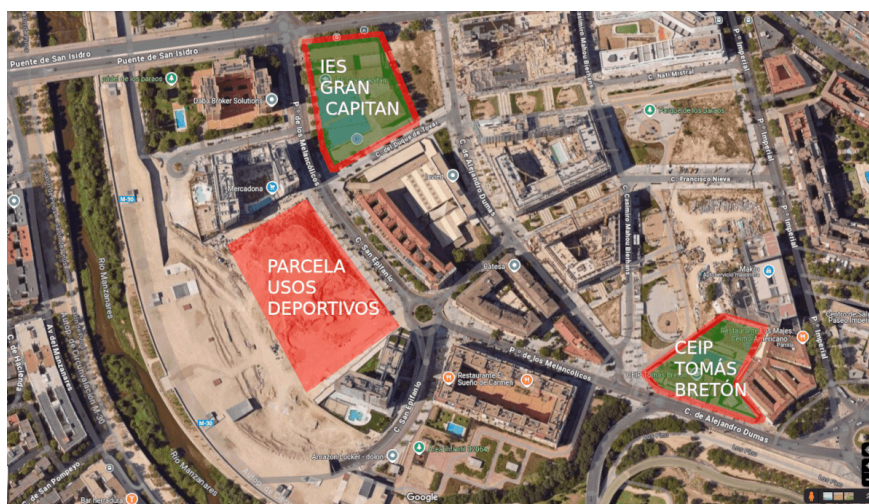
Figura 3: Parcelas implicadas. La parcela elegida para albergar el Museo de la EMT es la única lo suficientemente próxima al IES Gran Capitán como para servir de soporte para sus actividades educativas.