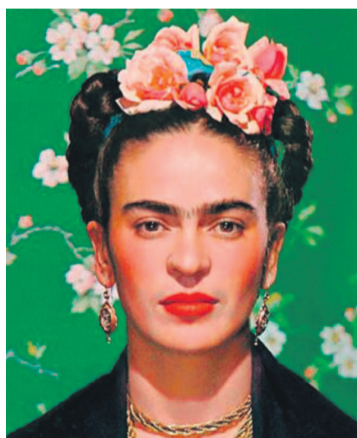
El Centro Cultural Paco Rabal mostrará una exposición sobre la pintora mexicana Frida Kahlo.

■ Feria del Libro de Préstamo e Intercambio (Libro Libre).