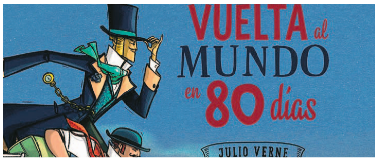
La popular novela de Julio Verne está de aniversario y dará pie a exposiciones y trabajos sobre 80 medios de transporte.

■ Participación en el “Certamen de Microrrelatos” de alumnos de 6º EP y 1º y 2º de la ESO. Con indicaciones y motivación del profesorado.