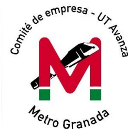
Comité de Empresa Metro Granada