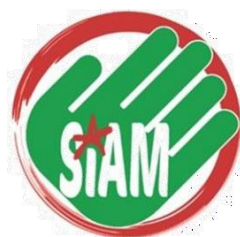
SIAM de Apoyo Mútuo