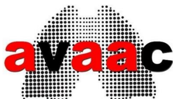
AVACC Asociación de Víctimas Afectadas por el Amianto en Cataluña