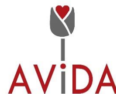
Avida Asociación de Víctimas del Amianto