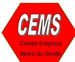
Comité de Empresa Metro Sevilla