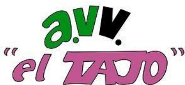
Asociación de Vecinos El Tajo