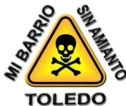
Mi Barrio sin Amianto