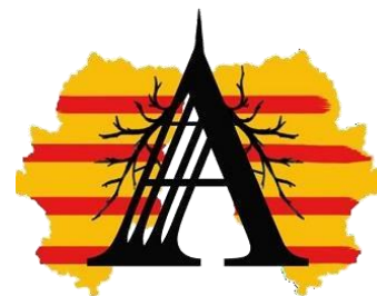
A4 Asociación de Afectados/as por el Amianto en Aragón