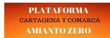
Amianto Cero Cartagena y Comarca