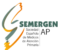
Sociedad Española de Médicos de Atención Primaria