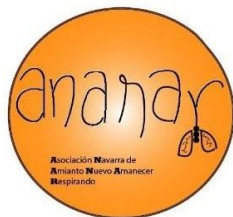
Ananar Asociación Navarra de Amianto Nuevo Amanecer Respirando