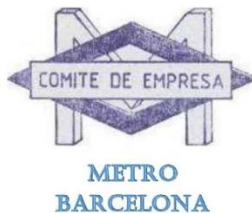
Metro de Barcelona (FMB) - Comité de Empresa