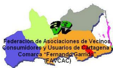
Federación de Asociaciones de Vecinos, Consumidores y Usuarios de Cartagena y Comarca «Fernando Garrido»