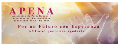
Asociación de Perjudicados y Afectados por Amianto APENA