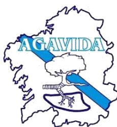
Agavida Asociación Galega de Víctimas do Amianto