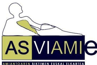
Asviemie Asociación de Víctimas del Amianto de Euskadi