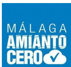
Málaga Amianto Cero