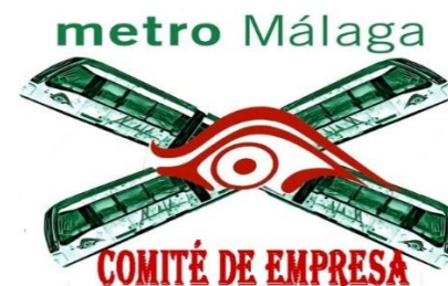
Comité de Empresa Metro Málaga