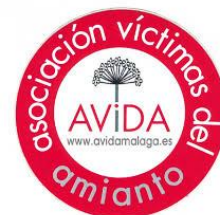
Asociación de Víctimas del Amianto Málaga AVIDA Málaga